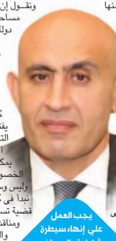
وزير التعليم العالي والبحث العلمي

كل محاولة للتطوير. هذا بعض ما يطرحه الوزير جانيب المزيد من التفاصيل، التي تتعلق بنظام المناهج وما نشتر عن عمليات دمج مواد علمية ومناهج، وتقليل وتخفيف بعض المواد. وربما يكون من الظلم الحكم بسرعة على صحة أو خطأ ما يتم إعلانه من خطط، خاصة أن النتائج تظهر بعد فترات، مثلما يحدث عادة، لكن ما يقترض أن ننظر إليه، هو أن تكون هناك متابعة واستيعاب للحورات التي تتم اجتماعيا أو في الحوار الوطني، حتى يمكن الاعتماد على أن ما يقال ليس مجرد كلام أو جلسات.